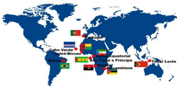
Figura 1 - O mundo da lusofonia

Futuros servidores , a vigência obrigatória do novo Acordo Ortográfico da Língua Portuguesa passou a valer a partir do dia 1º de janeiro de 2016 . Sua implementação estava prevista para 2013, mas o governo brasileiro adiou a medida para alinhar o cronograma com o de outros países lusófonos 1 e dar prazo maior para a adaptação da população.