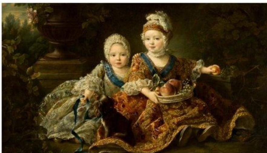
Louis XVI com seu irmão Louis XVIII

Alguns conceitos nos ajudam a estruturar como concebemos e entendemos o funcionamento da sociedade. A disciplina fornece ferramentas de interpretação através do desenvolvimento de conceitos explicativos da realidade.